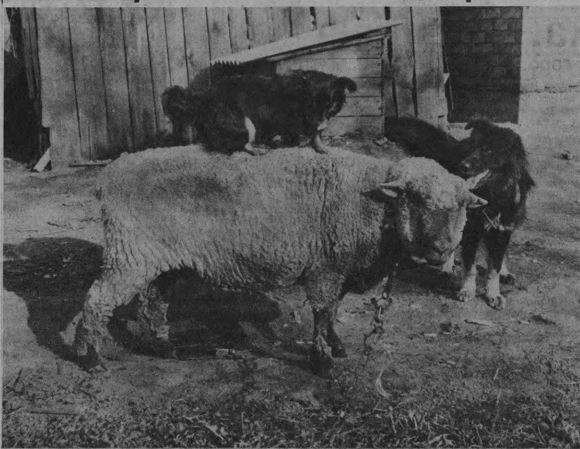
Хочешь жить - умей вертеться.