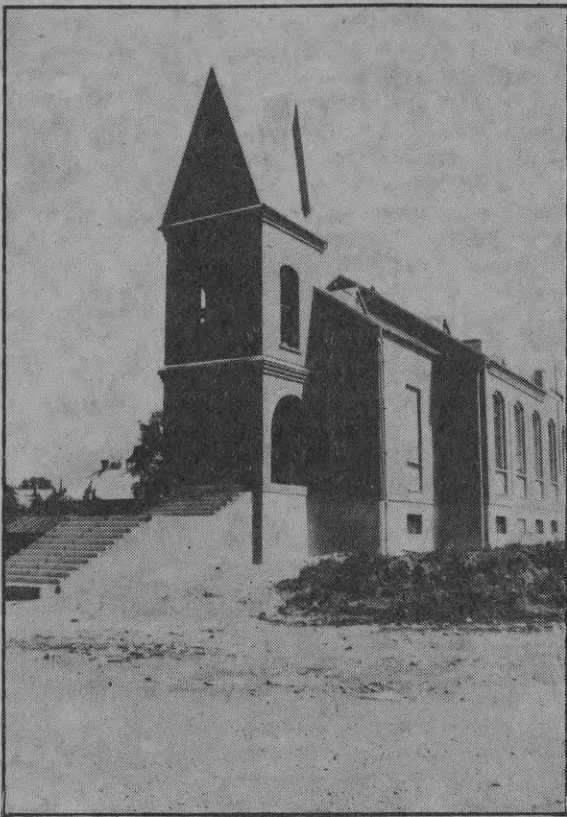
Вновь построенная церковь по улице Цериню

листы бывших и по-прежнему влачащих существование государственных стройорганизаций - инженеры, экономисты и начальники - оказались мямлями и недотепами, а не менеджерами и руководителями. Выходит, что мы чахнем, хотя работы вокруг полно. Тогда срочно надо ехать на рынок Матиса - может быть, еще удастся попасть на место пастуха или батрака, если уж не умеем перестроиться - приспособиться к новым обстоятельствам.