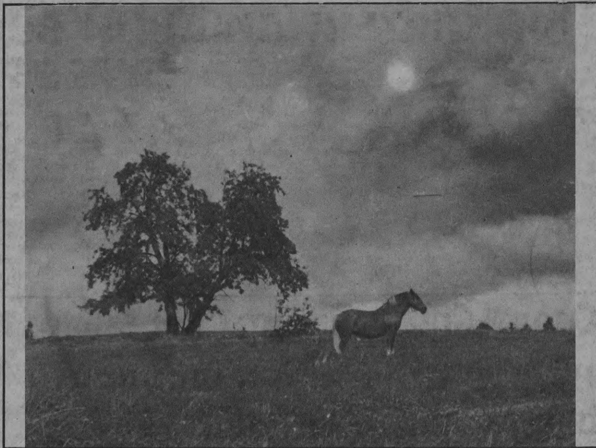
На что земля и солнце Без пахаря годятся? На что годится пахарь Без доброго гнедога?