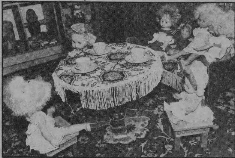
Все готово к занятиям.

Нет, специально на Запад в детсаде не ориентировались. Просто на сельмаше возникла производственная необходимость сдвинуть начало рабочего дня. Соответственно и в заводском детсаде день начинаться будет в девять тридцать и заканчиваться - в семнадцать тридцать. Это даже удобнее: дети смогут и выспаться дома, и целый день с ними будет одна воспитательница. Как на Западе.