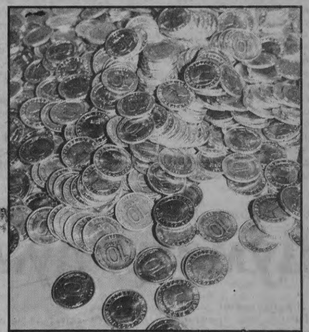
А. Пемперс

Будучи в гостях у пограничников в Элее, я посетил и таможенный пункт. Из-за нехватки времени не удалось подробнее расспросить о работе таможенников. Мы можем лишь продемонстрировать товары, задержанные на границе, которые перевозились для продажи в Литве, Польше или России. Кроме водки, здесь были, конечно, игрушки, сладости, даже цветной металл. На другом снимке вы видите деньги, высыпанные из мешка на стол таможенников - груда десятирублевых монет России.