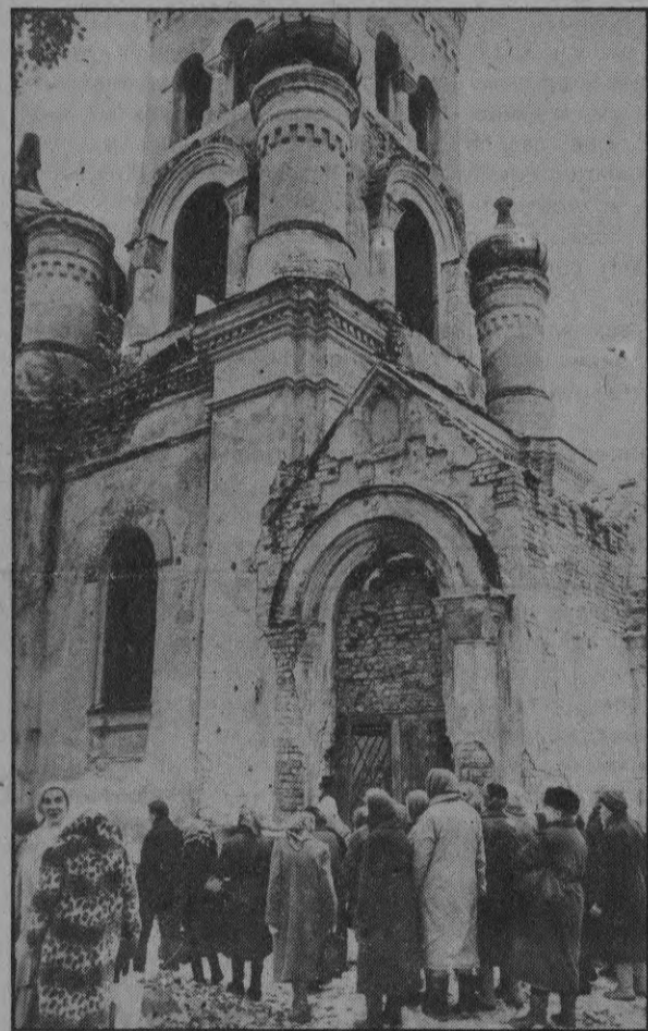
♦ Актуальное интервью

Замечательно, что первый молебен был отслужен в