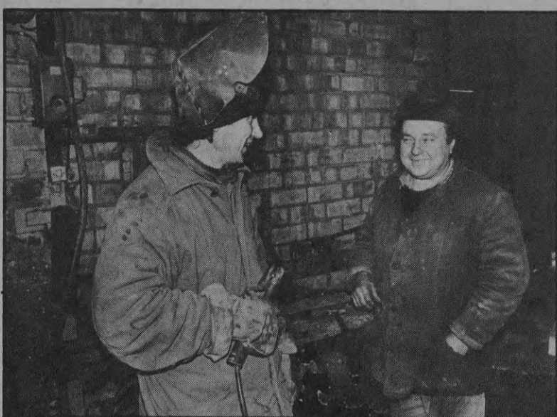
На снимках: безработные не теряют надежды; все - завод закрыт!

- Этому нужно положить конец! Еще весной было предложено собирать средства для будущего отопительного сезона, но домоуправление сказало - как-нибудь обойдемся. Хорошо, что хоть нашли возможность отапливать школу. Ведь это смешно, что теперь кинули клич жителям - в виде аванса дать деньги на приобретение угля. Людей так часто обманывали, что отзывчивость равна нулю. Надо бы взять в банке кредит и купить топливо. Как платить? Сдать в аренду коммерческим структурам