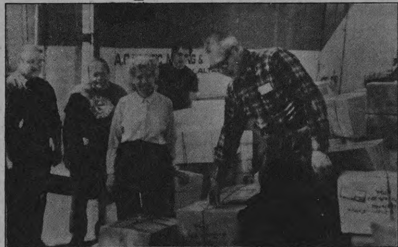
Эдмонтоновцы готовят посылки детям Сесавы