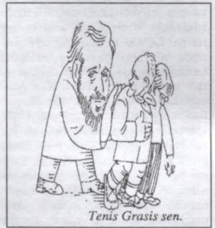
Tenis Grasis sen.

Vadonis uz laiku izdzen Kreitusu pāri no Latvvaldības Paradīzes! Tiem tiek dota iespēja "vaigu sviedros" nopelnīt atpakaļ nākšanas tiesības - uzpirkt un pārņemt LSDSP vai arī neveiksmes gadījumā pašiem nodibināt savu "sociāldemokrātisku" partiju.