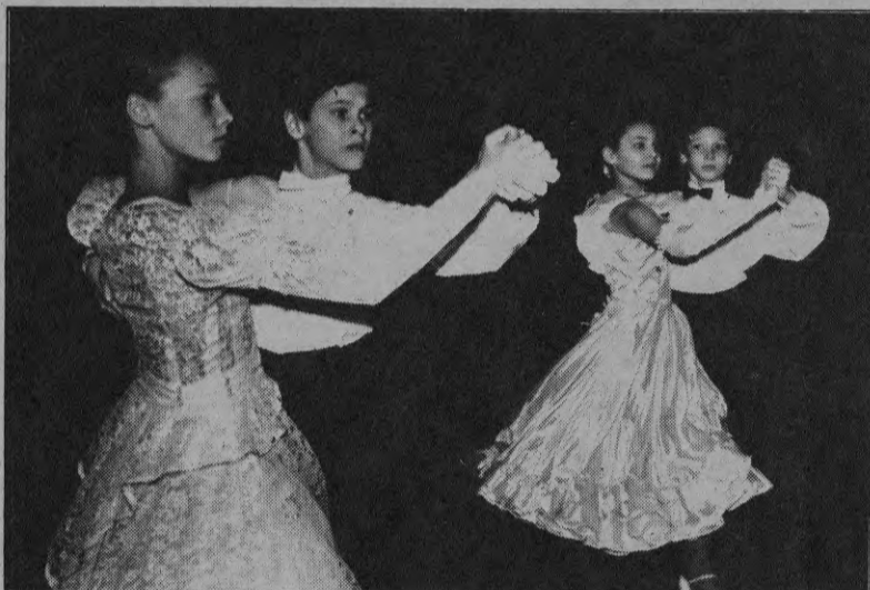
Танцоры класса "D"