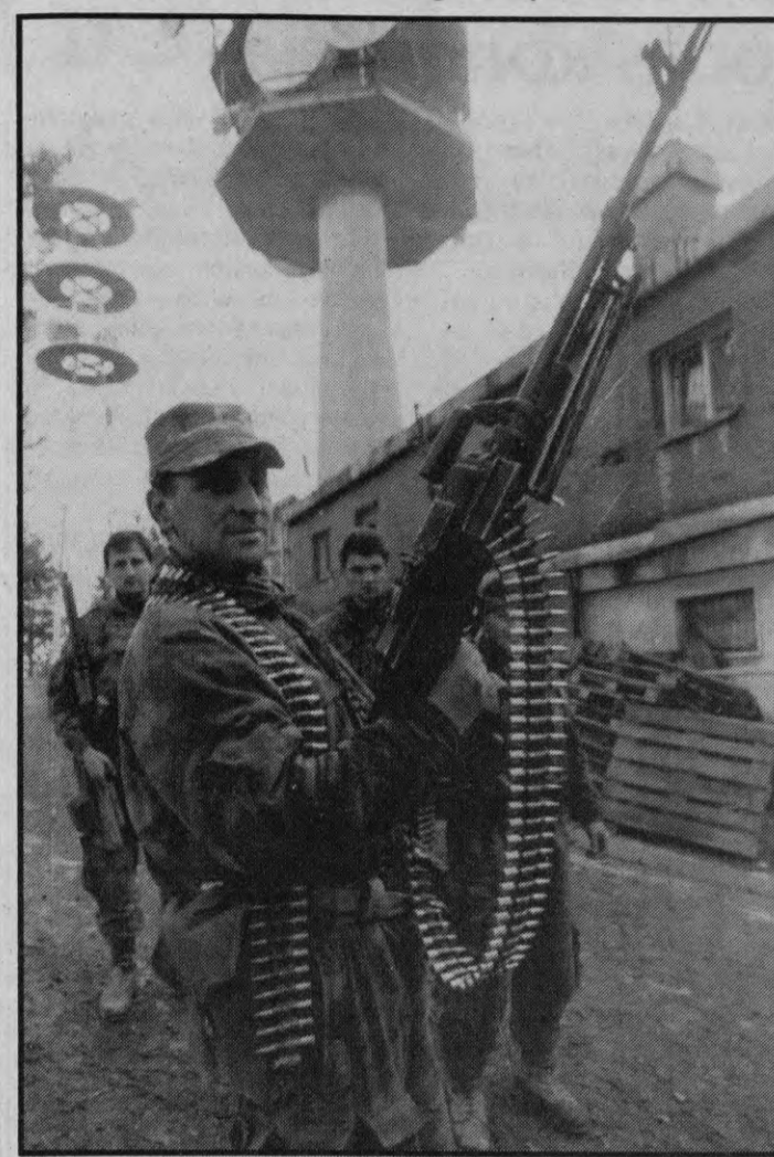
Bosnijas serbu kareivji Majevičas kalnā, kur atrodas serbu komunikāciju centrs un no kurienes iespējams pārlūkot musulmaņu pozīcijas Tuzlas pilsētā.

Tostarp otrdien ceļā devusies transporta karavāna, lai nokļūtu līdz gandrīz 200 000 pārtikas trū-kumā nonākušajiem iedzīvotājiem Bosnijas ziemeļrietumos Bihačas anklāvā, kur pēdējo dienu laikā ri-sinājušas spēģas serbu artilēri-jas apšaudes.