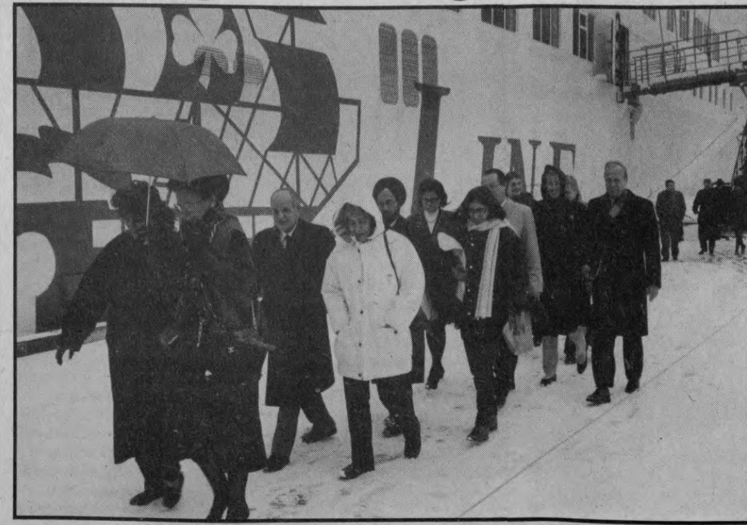
Ap 30 valstu Zviedrijā akreditētie vēstnieki ar dzīvesbiedrēm otrdien ieradusies Rīgā ar motorkuģi Iljics , atklājot jaunu kustības grafiku starp Rīgu un Stokholmu. Turpmāk, kā informē BNS , Iljics kursēs no Rīgas uz Stokholmu divas reizes nedēļā — otrdienas un ceturtdienas. Ar šo motorkuģi varot ceļot uz Stokholmu bez vizas, uzturtoies tur vienu dienu (no kuģa pienākšanas līdz atiešanai). Šādas izklaides vizītes laikā nav paredzētas oficiālas tikšanās, Dienai sacīja Ārlietu ministrijas preses centrs, vienīgi Indijas vēstnieks, kas akreditēts arī Latvijā, pietieciēs tikties ar ārlietu ministru. Pirmo reizi Latvijā vienlaikus viesojas 30 valstu pārstāvji.