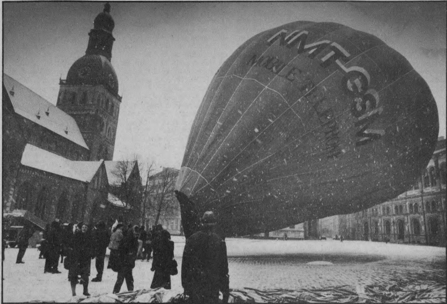
Otrdienas rītā no Doma laukuma bija paredzēta gaisa balona pacelšanās lidojumam virs Rīgas, tā atzīmējot Latvijas pirmā gaisa balona Vinnijs pirmā lidojuma gadskārtu. Diemžēl aprīlim neraksturīgie laika apstākļi — sniegs, kas krita lielām pārsļām — atturēja balonu pilotus pacelties gaisā. Paredzams, ka sestdien gaisa balonu lidojumi notiks Sīguldā.