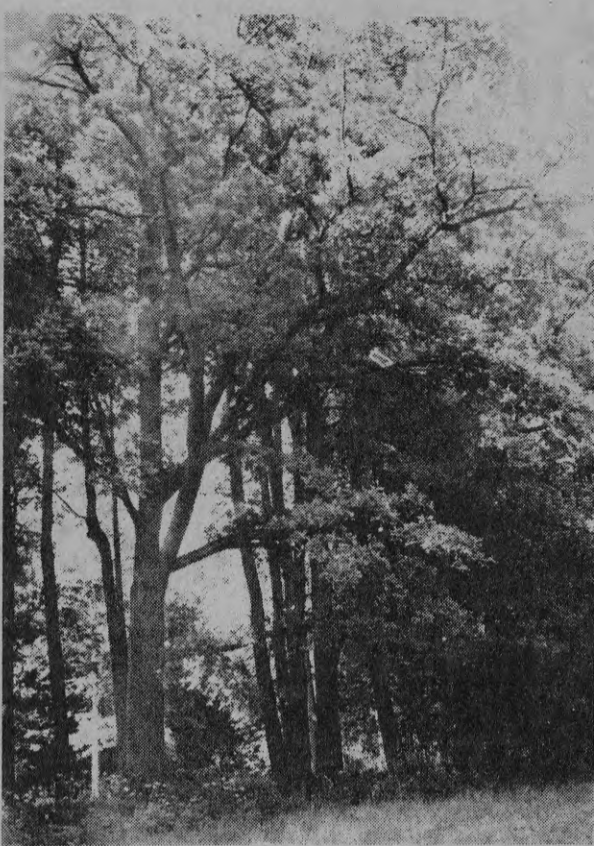
Дубы Элейского парка.