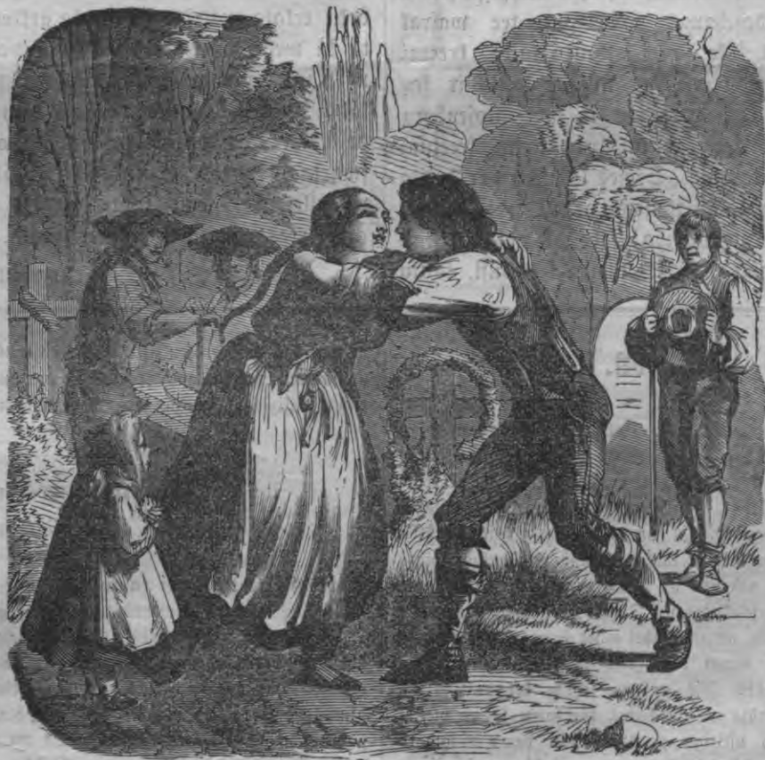
Pēe mahšes šapa (R. 236 l. p.)

Pehz tam nu it weegli war aprehkinat, zil no šcheem waj wineem mehšleem wajaga.