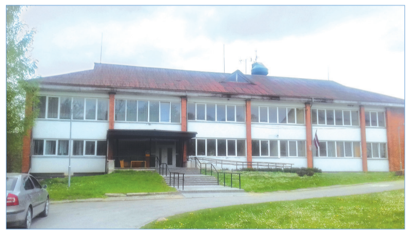
Lielaucē sociālā māja.

Sociālajā dzīvojamā mājā mītošie iedzīvotāji ir pārcēlušies uz dzīvi šeit no Aucē pilsētas un citiem novada pagastiem (Lielaucē, Bēnes, Ukru un Vītiņu). Ar Sociālā dienesta palīdzību šiem cilvēkiem ir dota iespēja pavadīt savas vecumdienas labos apstākļos. Lielaucē sociālā dzīvojamā māja dod patvērumu ne tikai veciem cilvēkiem, bet ir gadījumi, kad tiek dota pajumte krīzes situācijā vientuļai