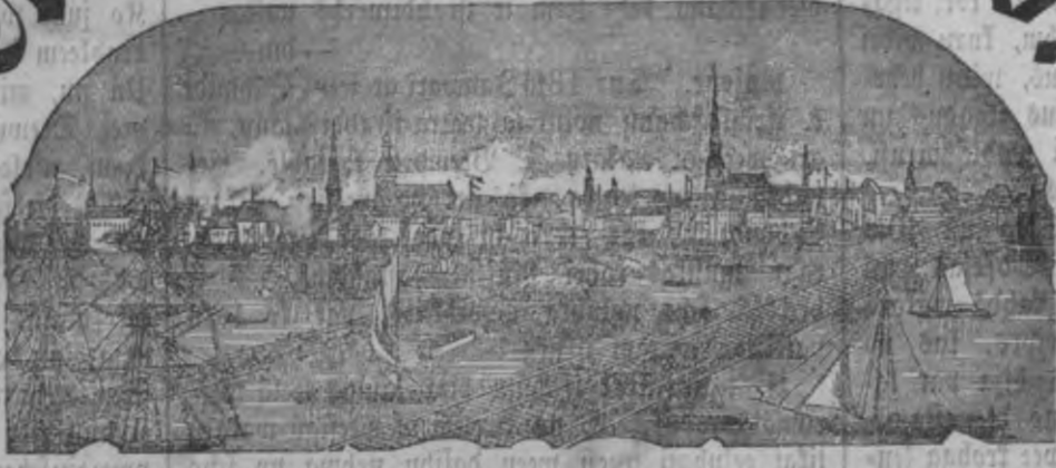
Mahjas weefis ijsnahl weenreis pa nedelu.

Mafsa ar weefufifchanu par pafsi: Ar weefufum: par gabu 2 r. 35 l. bes weefufuma: par gabu 1 " 60 Ar weefufuma: par 1/2 gabu 1 " 25 bes weefufuma: par 1/2 gabu " 85