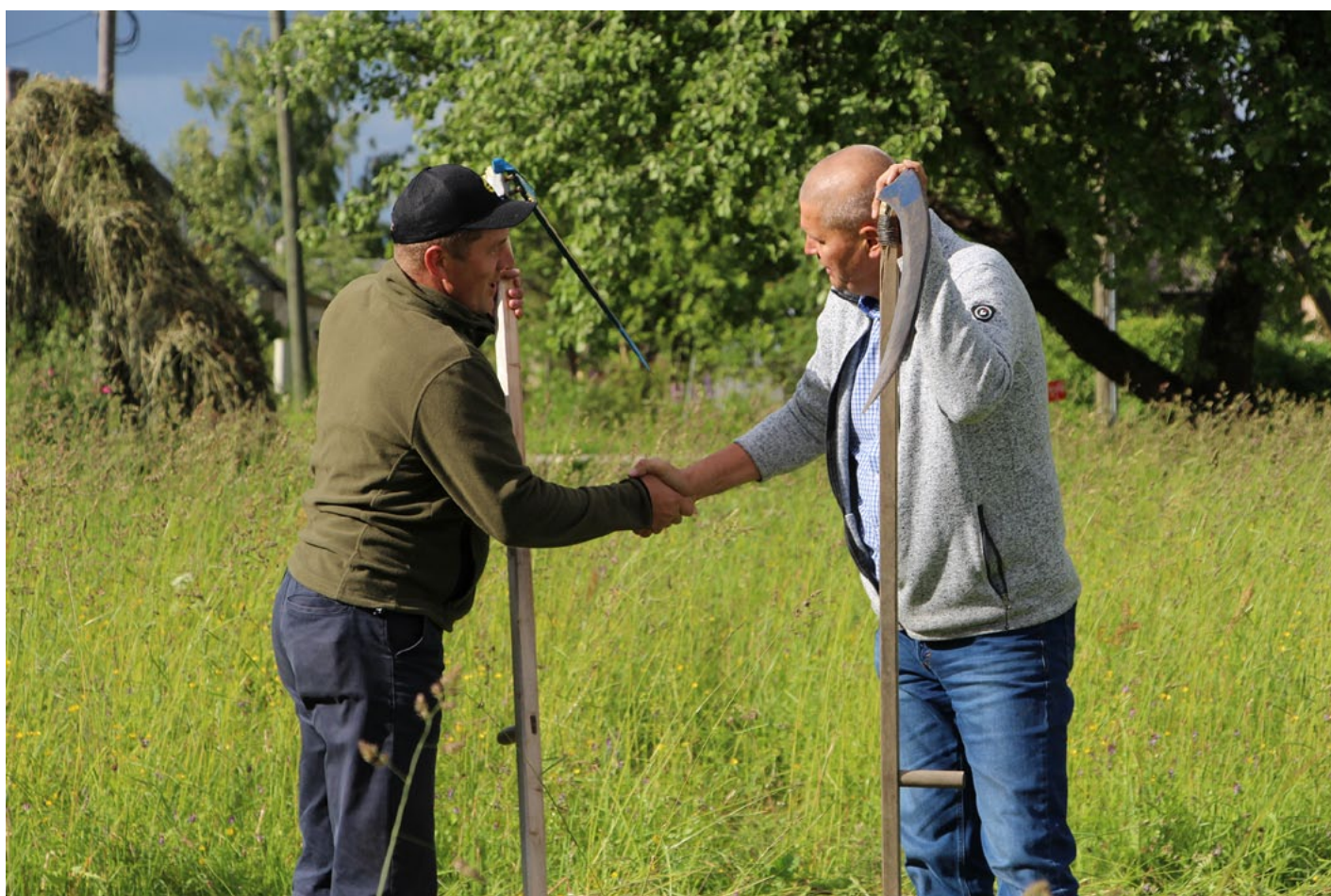
Pļāvēji pirms starta sasveicinās un vēl veiksmi cits citam