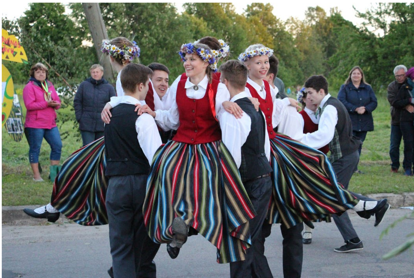
Deju kolektīva Resgaļi sniegums sasildīja ikvienu nosalušo skatītāju

P.S. Līgo svētku fotogalerija skatāma www.aloja.lv .