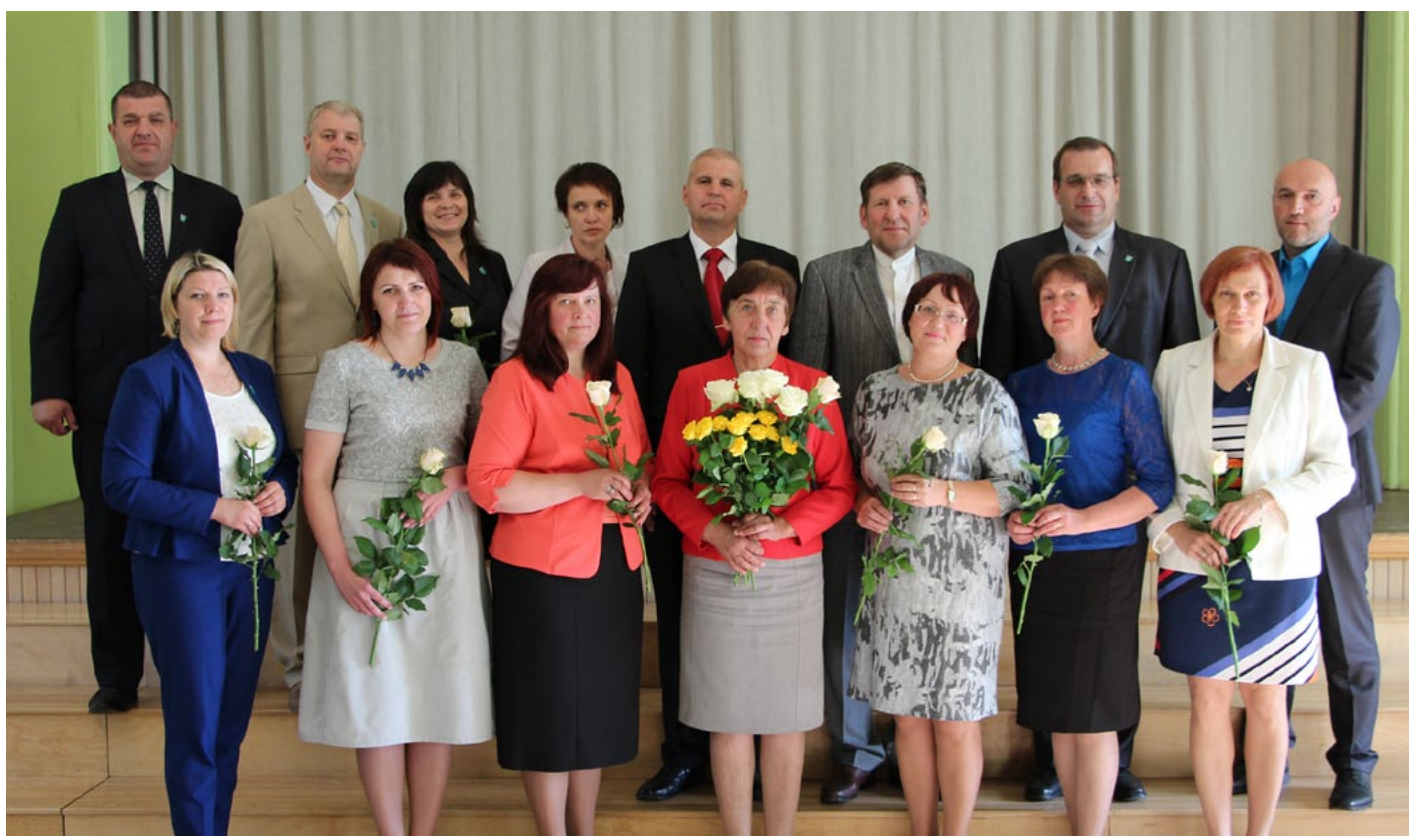
Visu 15 domē ievēlēto deputātu kopbilde