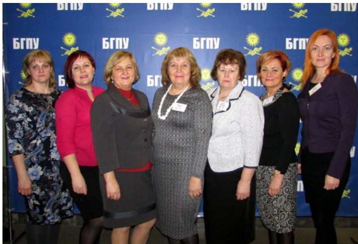
Līgatnes novada pirmsskolas izglītības iestādes skolotājas 16. starptautiskajos pedagogiskajos lasījumos Minskā.

Bērni ir kļuvuši citādi, citādi ir viņu uztvere, apziņa. Protams, arī laika un vides prasības atšķiras. Kā audzināt bērna sirdi? Šie un daudzi citi jautājumi nodarbināja izcilu pedagogu un zinātnieku prātus arī šogad 16. starptautiskajos pedagogiskajos lasījumos Minskā. Dalībnieki pārstāvēja