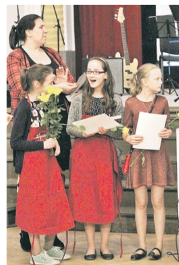
Vislabāko un labo pīrāgu cepēju titulu ieguvusi jaunā beķeru komanda.

Baltā galdauta svētki ir veids, kā svinēt Latvijas patiesās brīvības un neatkarības