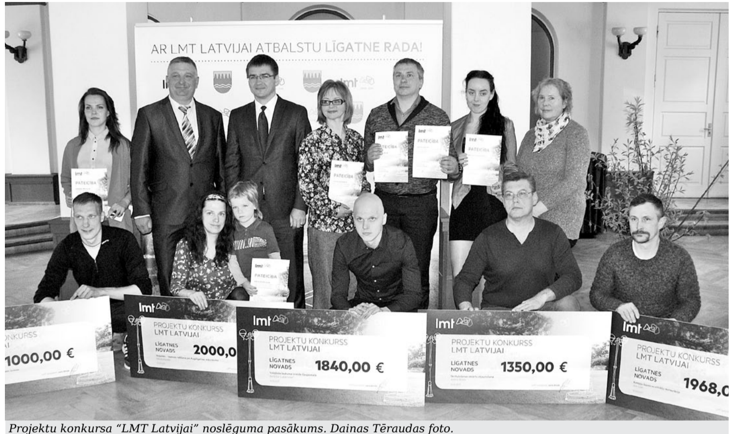
Projektu konkursa "LMT Latvijai" noslēguma pasākums.

2017. gada 10. maijā Līgatnes kultūras namā norisinājās "LMT Latvijai" projektu konkursa noslēguma pasākums. Pateicības saņēma visi projektu iesniedzēji, kuru projekti tika virzīti uz balsošanu. Atgādinām, ka "LMT Latvijai" projektu konkursam tika iesniegti 25 projektu pieteikumi un 20 projekti tika izvirzīti uz balsošanu. Šis bija konkurss novadu iedzīvotājiem, kuri vēlas ar idejām un projektiem piedalīties sava novada attīstībā, vienlaikus arī paši