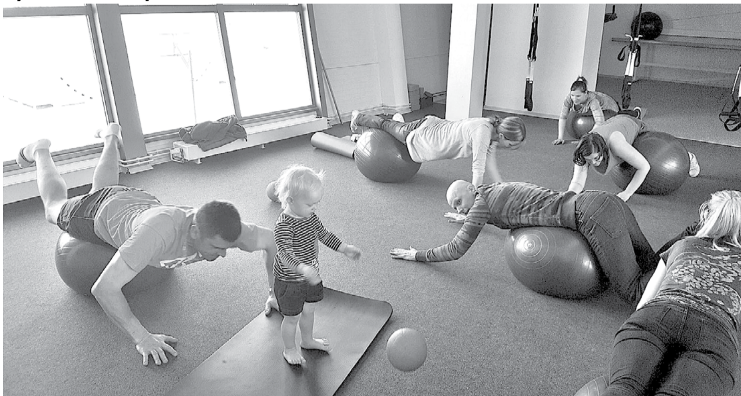
Ģimeņu sportošanas diena Līgatnes Sporta centrā.

Otro gadu Līgatnes Sporta centrā norisinājās Ģimeņu diena. Pasākums notika nepiespiestā gaisotnē. Vecāki varēja izmēģināt jaunas fiziskās aktivitātes, lai uzlabotu