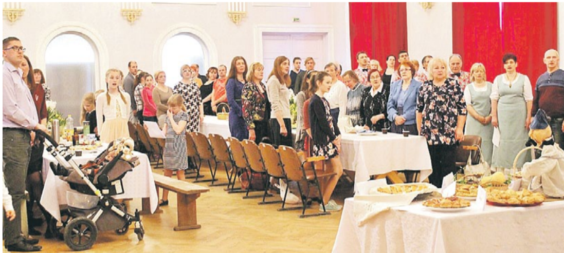
Baltā galdauta svētki Līgatnes kultūras namā 2017. gada 4. maijā.