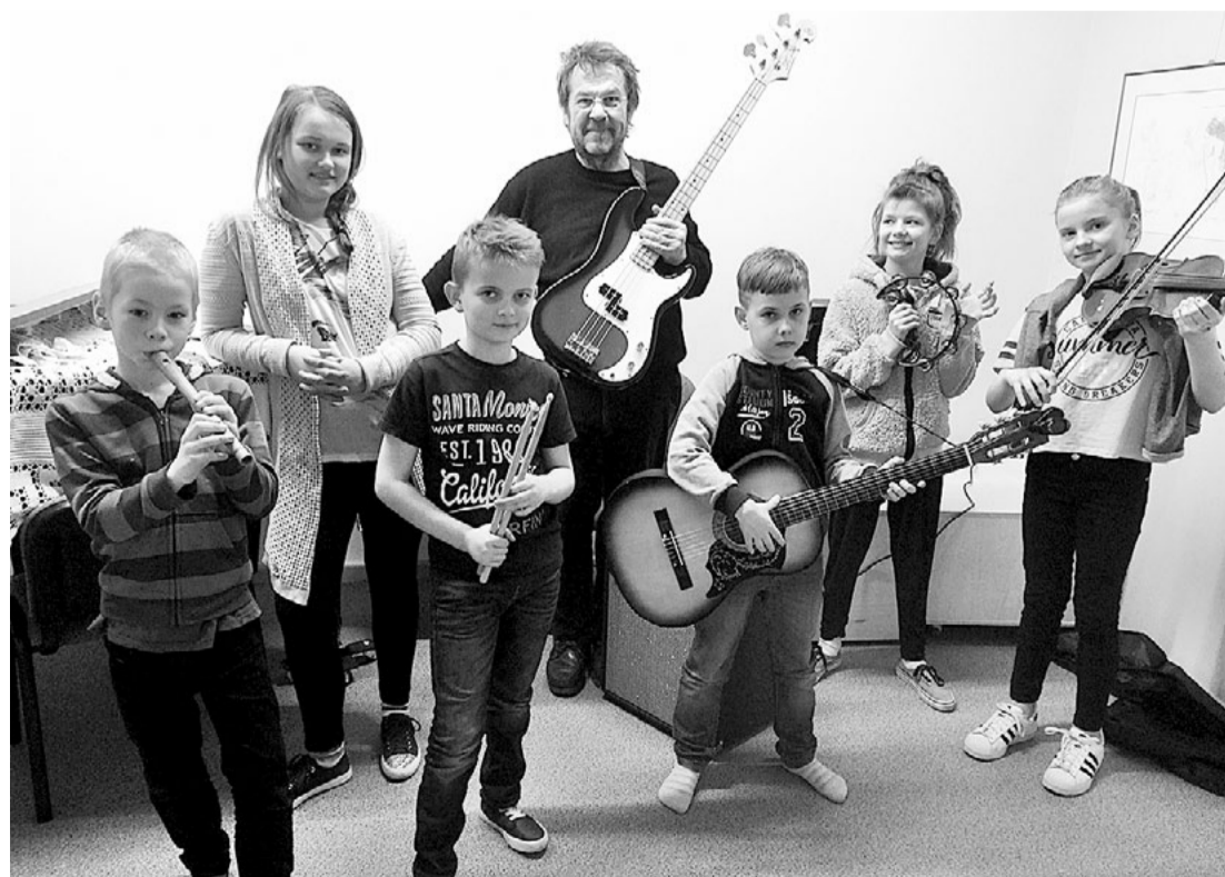
Līgatnes mūzikas studija mēģinājumā Augšlīgatnes kultūras namā.