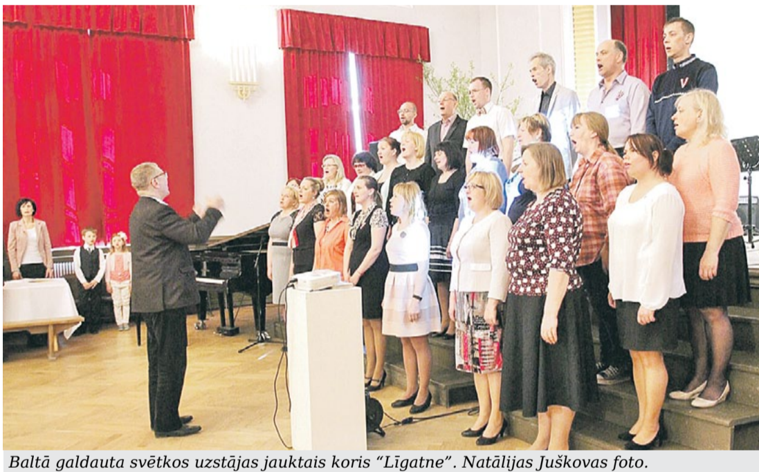
Baltā galdauta svētkos uzstājas jauktais koris "Līgatne".