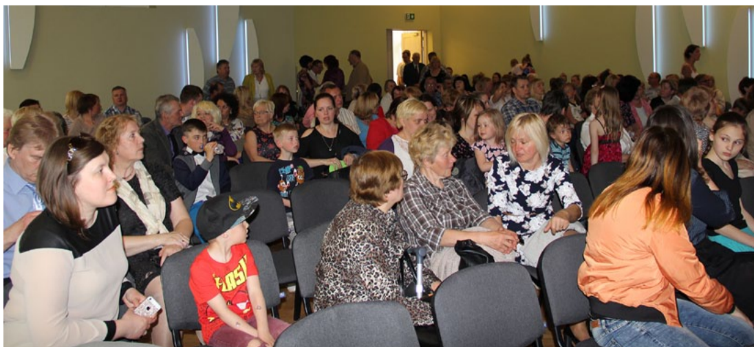
Augšlīgatnes kultūras nama lielā zāle.