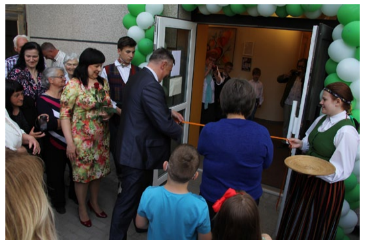
Tiek vērtas renovētā Augšlīgatnes kultūras nama durvis.