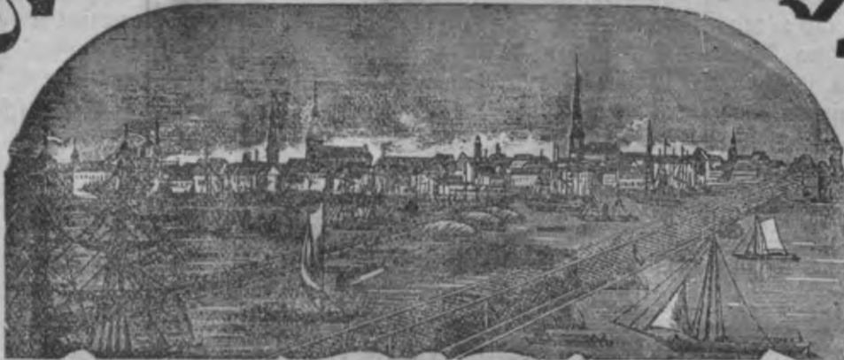
Mahjas Weefis isnahk weenreis pa nedetu.

Maksa bes peesubtiščanas Rīgā: Ar Peelikumu: par gadu 1 r. 75 L. bes Peelikuma: par gadu 1 " — " Ar Peelikumu: par 1/2 gadu — " 90 " bes Peelikuma: par 1/2 gadu — " 55 "