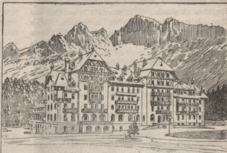
Skareras ejera weeņniza Tirolē.

pamestas, tihlihdņ pawedejam tās apniņuschas? Waj nenoteek tif leelā ņkaitā paņchnahwibas aij ņchi eemeņla? Saunā laikā gandrihs iņkats awiņchu numurs ņinoja par weenu tahdu gadijumu. Za A. nebuhtu tiktahņt dņihwē eedņilinajees, ka winam tas buhtu pagahjis garam, ar ko leela dala no muhsu jaunās paandņes ņaņirguse, ar ko ņlimo muhsu laikmets, tad waru dot winam wairak neka weenu pateest notiņuschu gadijumu, kas „Poestijai un profai“ tā ņakot war noberet par pamatu. Dums te ir darischana ne ar kahdeem isdomajumeem, bet pateest notiņuschām