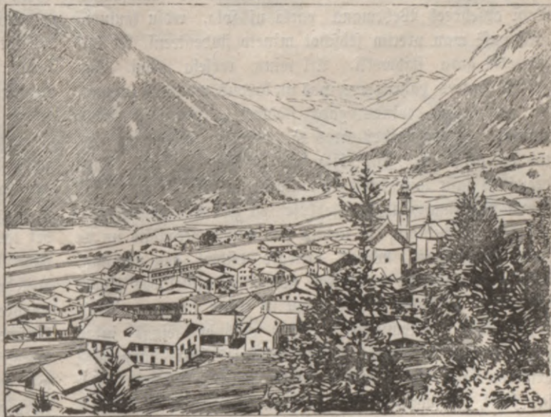
Gosenņajas zeems Tirolē.

leetam, protams, zitadā ņawirņnejumā un tehrpā. Man grib aisleeht attehlot realo dņihwi? Tas nosihmē to paņchu, ka nemt man ņpalwu no rokam, jo zitadi es newaru! Es newaru liht paweņtas meitenes tehvam tā nerunat, jo man katra darbojoņcha persona jarahda ņawā individualā buhtibā. Es newaru leetai kaut atkahtptees no ņawa elementa un atkahtptees no ihņtenibas, weenalga, ja ari tur deņmit dekadentu dabutu kahweenu. Es par to atbildibu nenemos un newaru uņnemtees.