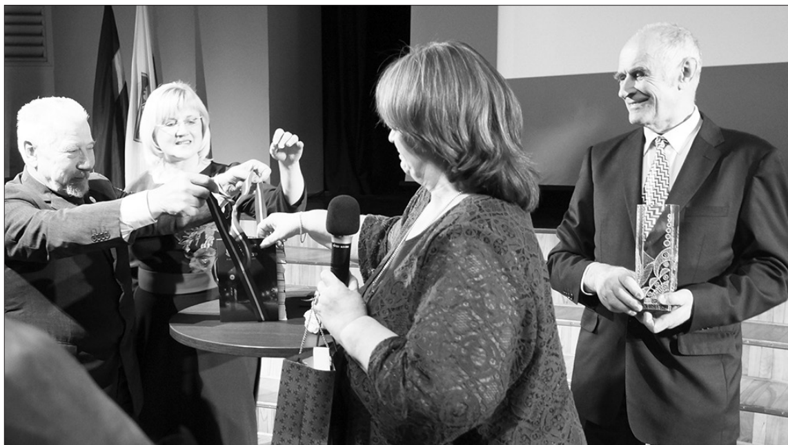
Pirmie balvu nominācijā “Sabiedrība” saņēma Latviešu biedrība par projektu “Cildinot izcili paveikto”, kas pasākuma laikā atklāja izdoto grāmatu par Aizkraukles Goda pilsoņiem.