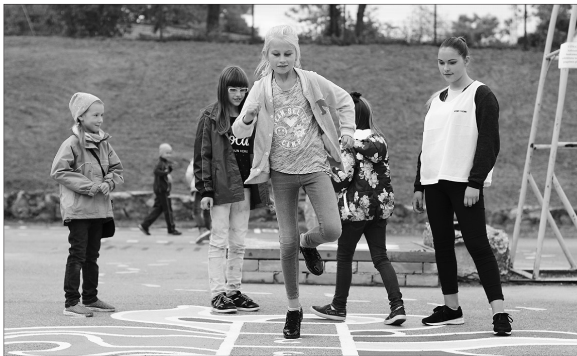
Atklāšanas dienā jauno laukumu iemēģina bērni.