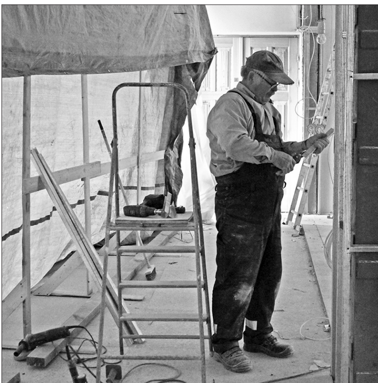
KAC telpu pārbūvi veic SIA "RL būvnieks" darbinieks.

Klientu apkalpošanas centra mērķis ir sniegt informāciju un konsultēt privātpersonas un uzņēmējus par pašvaldības sniegtajiem pakalpojumiem, to saņemšanas kārtību, procedūru un nepieciešamajiem dokumentiem, sniegt konsultācijas par valsts iestāžu (Uzņēmumu reģistra, Lauku atbalsta dienesta, Lauksaimniecības datu centra, Valsts ieņēmumu dienesta, Valsts darba inspekcijas) pakalpojumiem un valsts iestāžu e-pakalpojumu lietošanu saskaņā ar noslēgtajiem sadarbības līgumiem. Klientiem tiks sniegts atbalsts valsts portāla latvija.lv ievietoto e-pakalpojumu lietošanā, darbā ar datoru, e-parakstu un e-adresi.