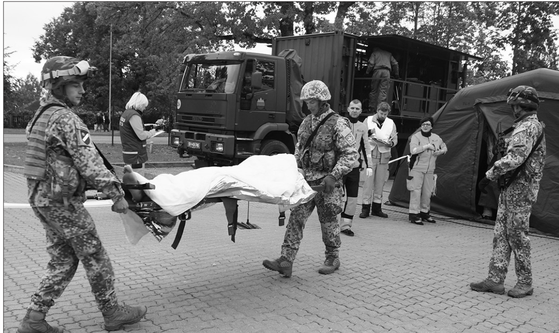
Zemessardzes 55.kājnieku bataljona vīri nogādā cietušo pie mediķiem.

“Mēs nekad nevaram paredzēt krīzes situāciju, taču šādā veidā, trenējot savas sadarbības prasmes ar dažādiem glāb-