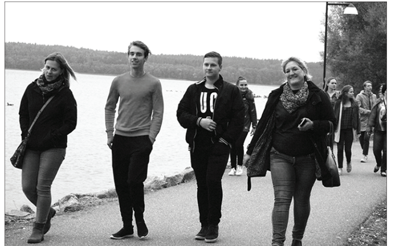
Aizkraukles Ekoskolas pārstāvji.

Seminārā Latviju pārstāvošās Ekoskolas darbosies, projekta pirmajā gadā īstenojot Life-Link rīcības, kas gan ļoti viegli iekļaujas ikgadējā Ekoskolu Rīcības plānā. Baltic