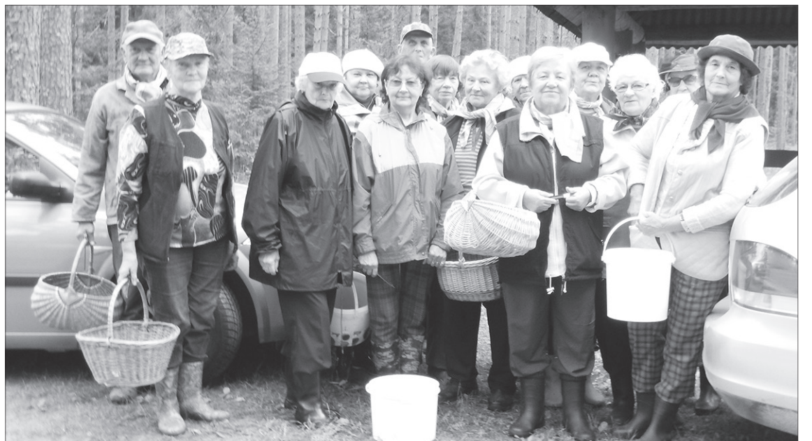
Aizkraukles komandas gatavas pirms Sēņošanas čempionāta starta.