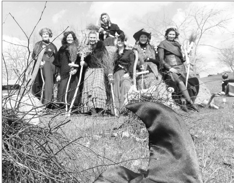
Ar katru gadu pieaug biedrības “Daugavas senielejas raganas” aktivitātes un atpazīstamība.