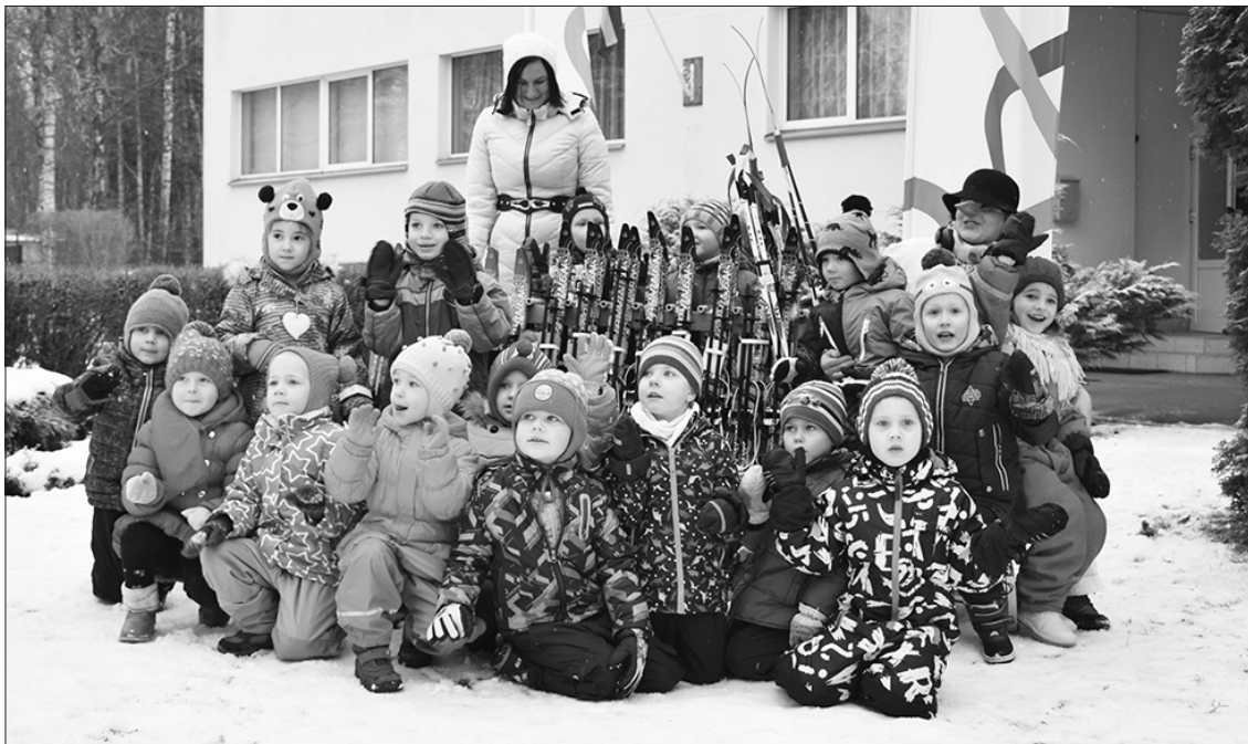
Vislielākais prieks par slēpošanas inventāru – bērnu audzēkņiem.