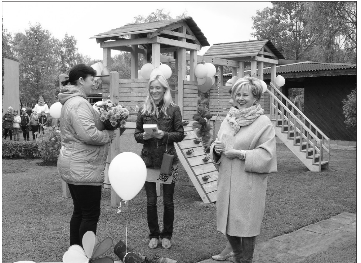
Pēc PII "Auseklītis" grupiņas "Krustiņš" vecāku iniciatīvas pašvaldība finansiāli atbalstīja jaunus rotaļlaukuma elementus.

To, ka PII "Auseklītis" tiešām aktīvi apgūst un izmanto jaunās tehnoloģijas un interneta vides sniegtās iespējas, var redzēt sociālajā portālā facebook.com . Kopš 2016. gada visas savas aktivitātes PII "Auseklītis" atspoguļo savā mājas lapā – PII "Auseklītis" Facebook lapā. Interesējošās bildes var arī lejupielādēt.