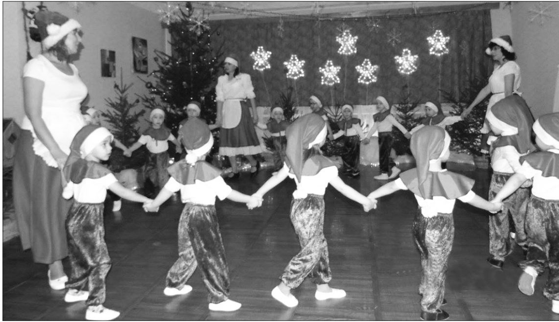
Viens no PII "Auseklītis" grupiņu Ziemassvētku priekšnesumiem.

Oktobrī Maizītes nedēļā iestāde smaržo pēc ceptām bulciņām un picām, ko gatavo