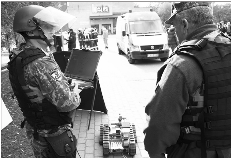
Civilās aizsardzības mācībās Aizkraukles novada vidusskolā tika izspēlēta situācija ar spridzekli. Attēlā redzamais robots devās to neutralizēt.

Jāuzsver 2017. gada notikumi, kuri vienojuši vairākus ar drošību saistītus dienestus sadarboties un iesaistīt ar drošību saistītos pasākumus izglītības iestāžu audzēkņus.