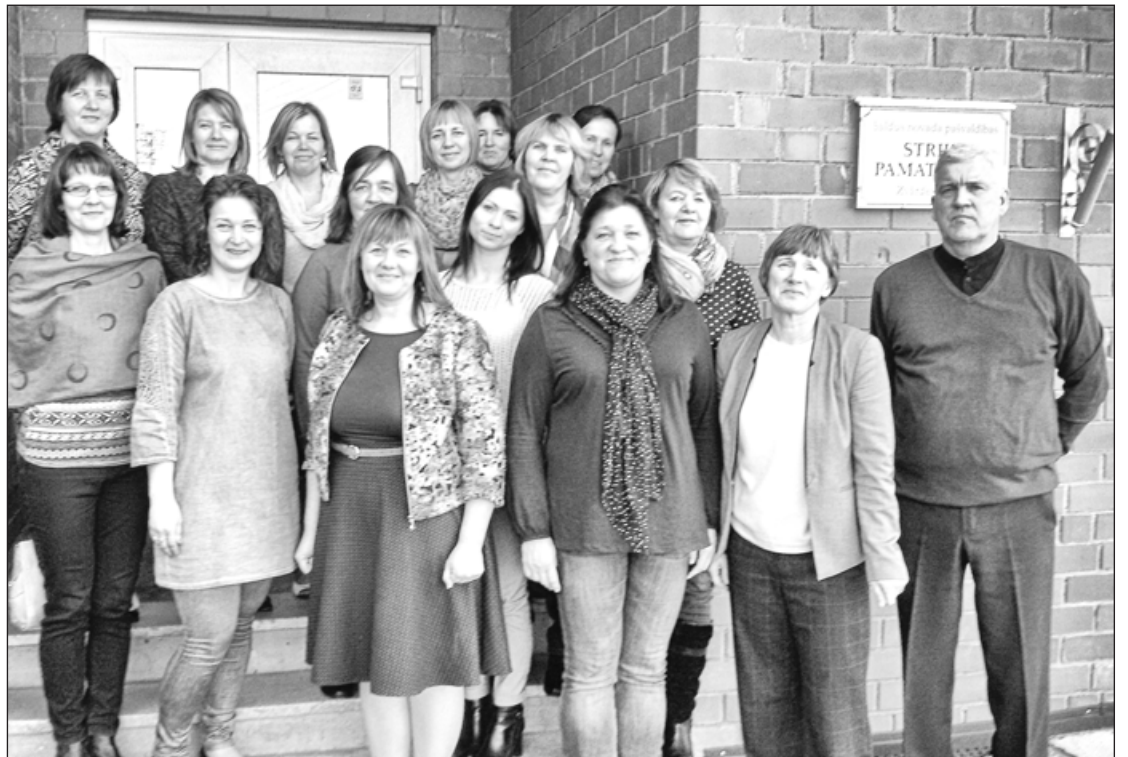
Dzērves pamatskolas skolotāji kopā ar Strīku pamatskolas kolēģiem

Skolēnu pavasara brīvdienų laiks skolotājiem parasti ir pārpilns ar dažādiem darbiem, kas saistīti gan ar skolu pedagoģiskās padomes sēdēm, novada mācību priekšmetu MA organizētajām apspriedēm par valsts pārbaudes darbiem, eksāmeniem, kursu nodarbībām, lekcijām. Katru gadu rodam laiku, lai dotos kādā jau iepriekš izplānotā pieredzes apmaiņas braucienā. Šoreiz mērojam ceļu uz Saldus novadu, lai paciemotos Zirņu un Strīku pamatskolās.