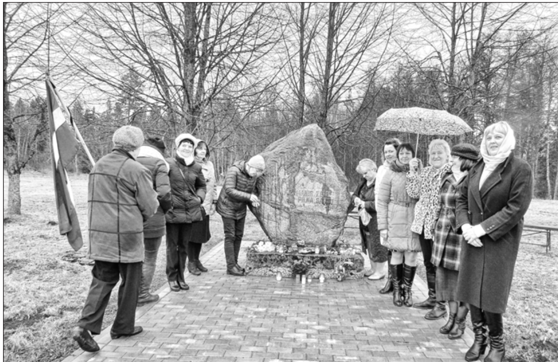
Pie represēto piemiņas akmens Kalvenes dzelzceļa stacijā

Šajā dienā – 25.martā droši vien daudzi cilvēki, liekot roku uz sirds, varēja teikt: “Jā, arī es kādu brīdi domās un vārdos izdzīvoju, ieklausījos cilvēkos mums līdzās, TV raidījumos, aculieciniekos, kuru stāsti saistās ar skaudro vēstures dienu, kad uz tautas vaiga sasala asara, bet laika upes krasti krāsojās dedzinoši sarkani.” Kopš tās liktenīgās dienas Latvijā gandrīz nav tādas dzimtas, kurā nebūtu kāda tukša vieta pie saimes galda. Anda Līce, kuru kopā ar vecvecākiem un mammu izsūtīja uz Amūras apgabalu 1949. gada 25. martā, savā darbā raksta: “Latvija arī ir kā tāds liels lakats, kas mani apņēma no visām pusēm. Tās četri novadi kā lakata stūri – ar bārkstīm līdz zemei. Vai līdzīgi mani neapņēma arī dzīve? Un četri gada un mūža laiki? Katrs ar citādu krāsu salikumu un toņu piepildījumu...”