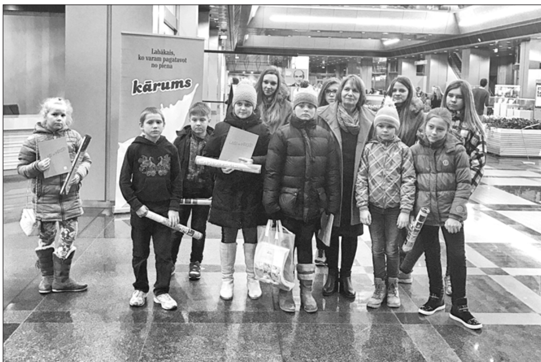
Bērnu žūrijas dalībnieki lasīšanas svētkos Rīgā

* Pirmais pavasara mēnesis bibliotēkā aizritējis aktīvā gaisotnē. 11. martā, Latvijas Nacionālās bibliotēkas (LNB) Ziedoņa zālē notika lasīšanas veicināšanas programmas “Bērnu, jauniešu un vecāku žūrija- 2016” noslēguma pasākums – “Lielie lasīšanas svētki”, kurā piedalījās ap 800 žūrijas eksperti no visiem Latvijas novadiem. Dalībnieku vidū bijām arī mēs, Kalvenes pagasta bibliotēkas aktīvākie programmas dalībnieki. Bērnu, jauniešu un vecāku žūrija ir kļuvusi par ilggadīgu tradīciju. 2016. gadā lasīšanas maratonā iesaistījās 19 969 lasītāji no 712 Latvijas bibliotēkām. Lielie lasīšanas svētki Rīgā notika jau 15. reizi.