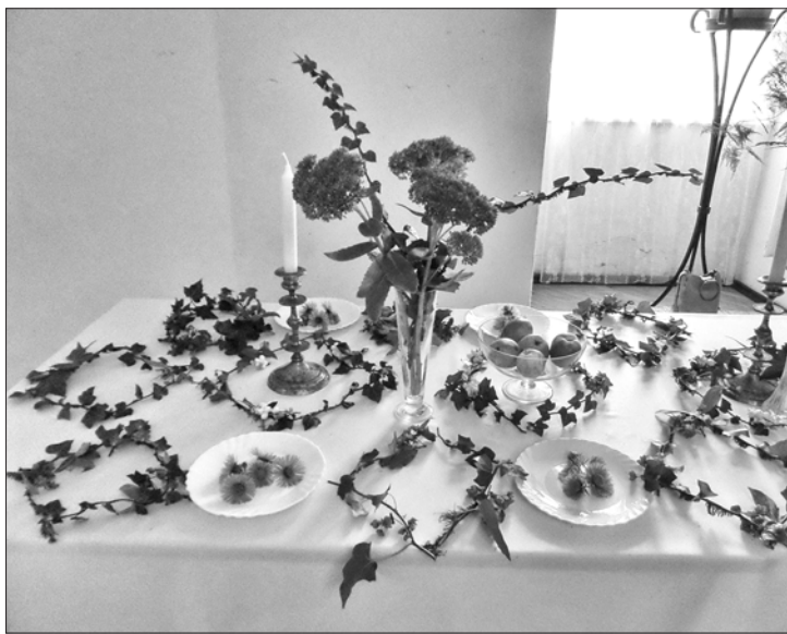
Praktiskajā nodarbībā izveidotais galda dekorējums

Laikā, kad rudens sāka krāsot koku lapas košās krāsās, Kazdangas pilī norisinājās konference "Svētki Kurzemē. Telpu un galdu dekorēšana piļu un kungu māju interjeros 20.gs.sākumā". Jau trešo gadu Kazdangā tiek organizētas šāda veida konferences, lai turpinātu jau iesāktu tradīciju ar mērķi izziņāt kultūrvēsturisko mantojumu, saglabātu vēsturisko vidi Latvijā, rastu iespējas un risinājumus Latvijas piļu un muižu ansambļu un parku saglabāšanā un atjaunošanā.