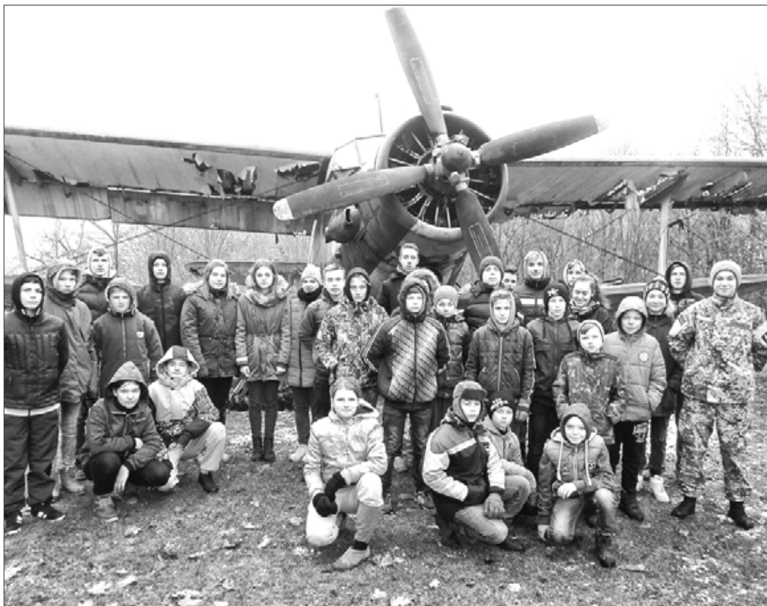
Jaunsargi ekskursijā Kurzemes cietokšņa muzejā

Novembra mēnesī, kad Latvijas valsts atzīmē un svin svarīgus notikumus mūsu tautas vēsturē, Aizputes novada jaunsargi aktīvi tajos iesaistās. Šogad tie bija NBS LR 99. gadadienai veltītā parāde 11. novembra krastmalā Rīgā, kur viņi piedalījās kā dalībnieki, tā arī kā parādes vērotāji klātienē. Aizputes vidusskolas jaunsar-