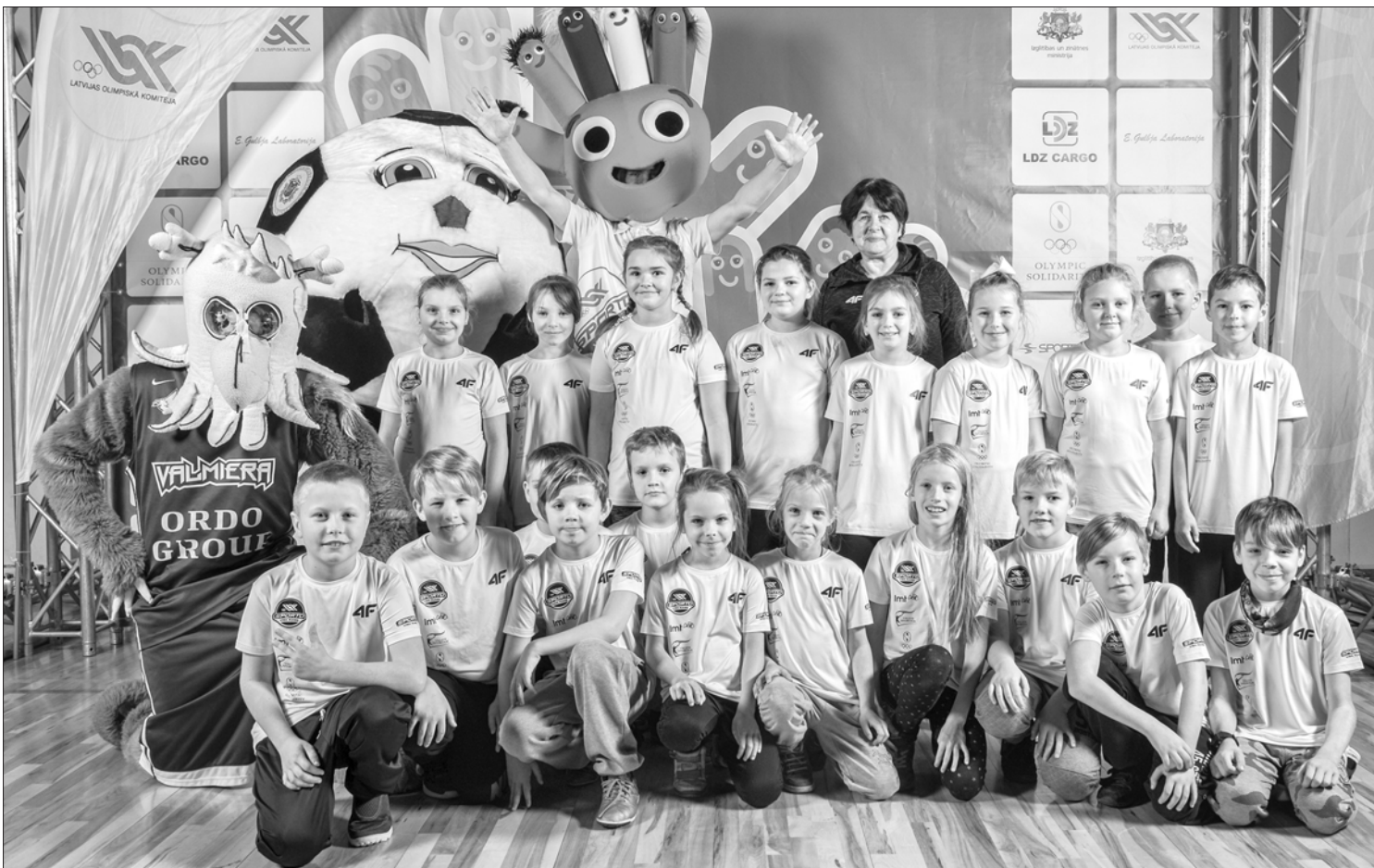
Māteru Jura Kazdangas pamatskolas 3.klases skolēni atklāšanas pasākumā Valmierā

Šajā mācību gadā Latvijas Olimpiskā komiteja (LOK) organizē projektu „Sporto visa klase” ceturto sezonu. 2017./