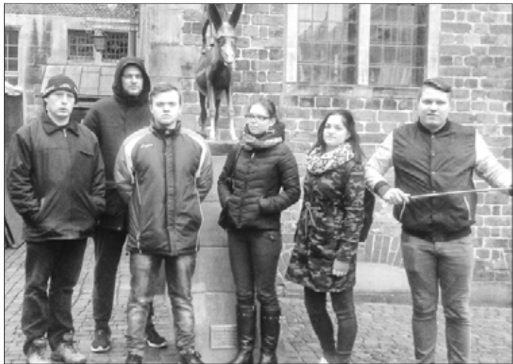
Praktikantu grupa Brēmenē

Pavisam nesen Kandavas Lauksaimniecības tehnikuma Cīravas teritoriālās struktūrvienības izglītojamie atgriezās no prakses Vācijā (projekts Nr. 2017-1-LV01-KA102-035308). Jaunieši bija ļoti apmierināti ar Vācijā pavadīto laiku un iegūto darba pieredzi.