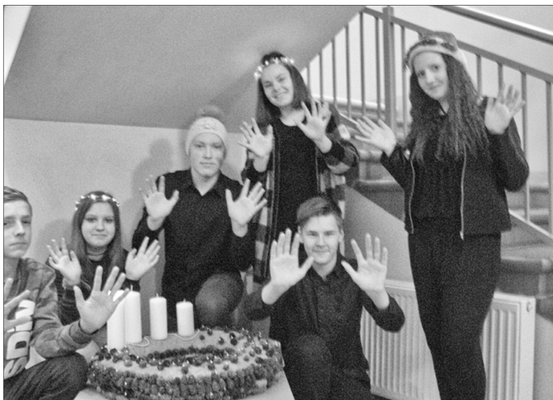
Devītās klases skolēni novēl pārējiem priecīgu Ziemassvētku gaidīšanu pie skolas Adventa vainaga