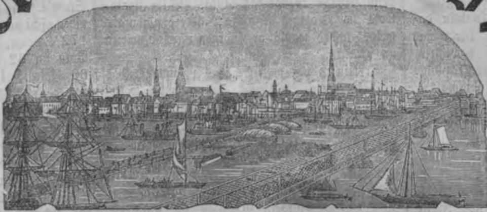
Mahjas Weefis isnahk weentreis pa nedetu.

Ar pascha wifašchēlīga angļa Reifara weleschanu.