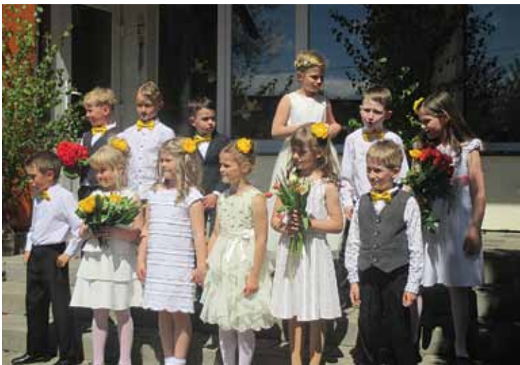
Babītes PII grupas „Rūķīši” audzēkņi ceļā uz 1. klasi.

Informāciju sagatavoja Sanita Baginska, Babītes vidusskolas sabiedrisko attiecību speciāliste