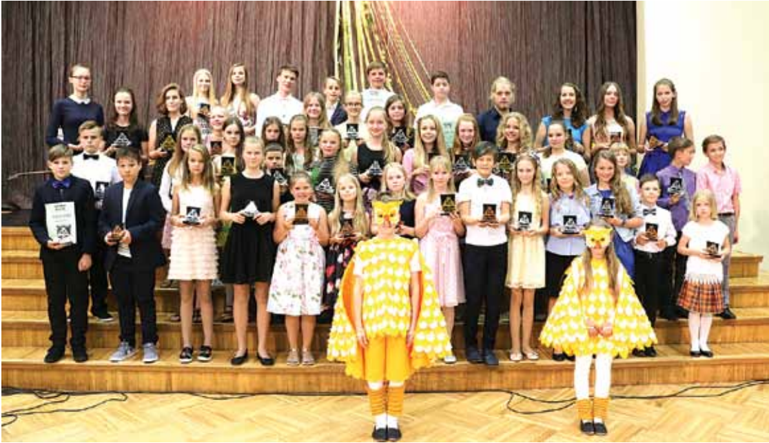
Apbalvojuma „Pūce” ieguvēji Babītes vidusskolā 2016./2017. mācību gadā.