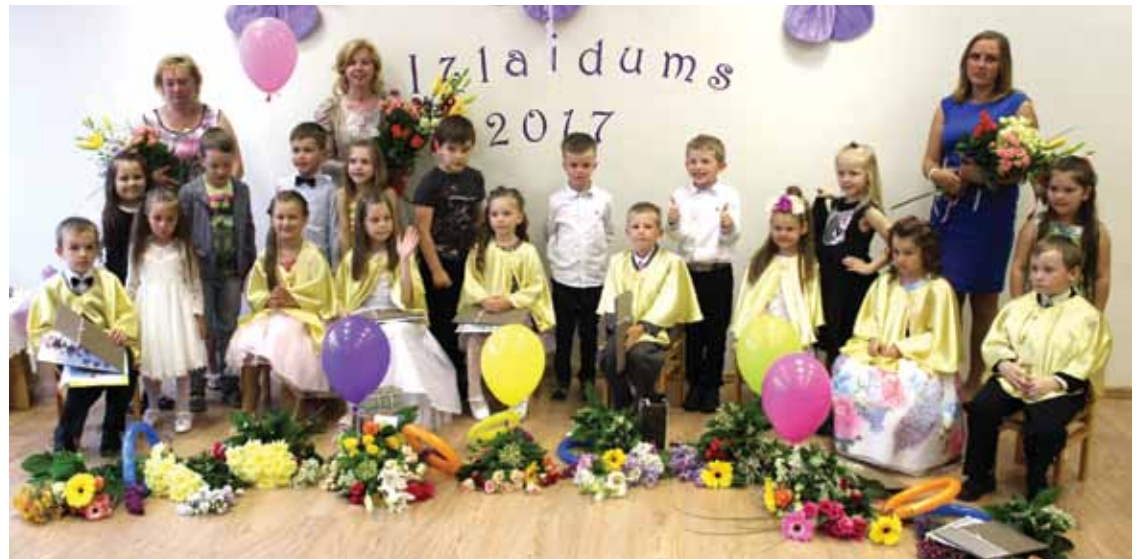
Salas sākumskolas pirmsskolas izglītības grupas „ABC” audzēkņi 1. septembrī uzsāks skolas gaitas.