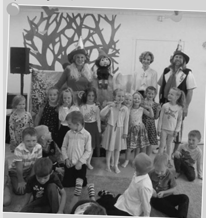
1. septembra pasākums Babītes PII.

Šajā mācību gadā uzņemto bērnu skaits: 21