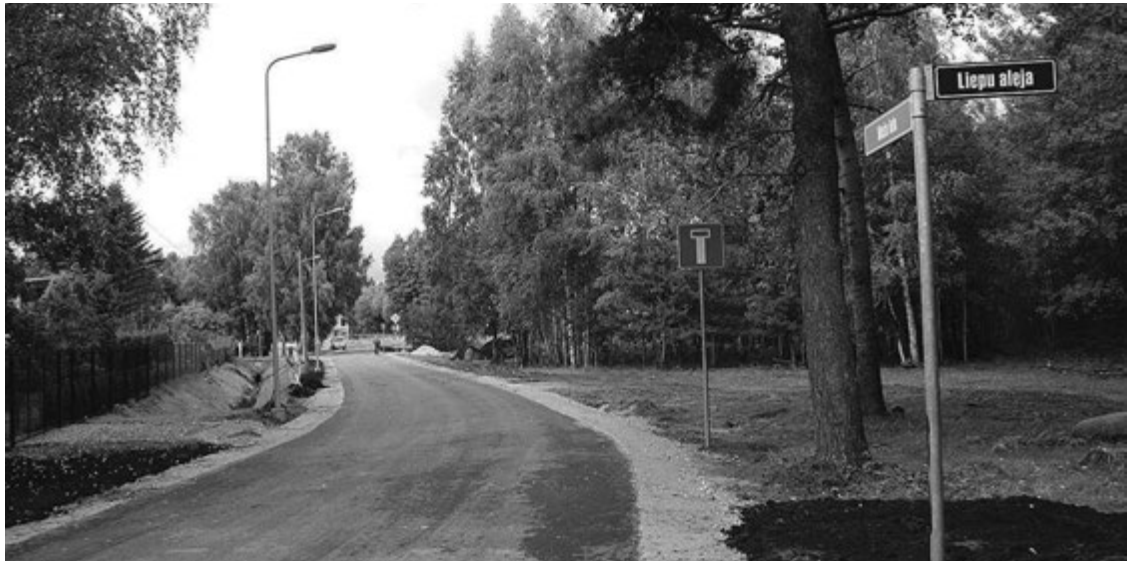
Babītē turpinās Meža ielas pārbūves darbi.