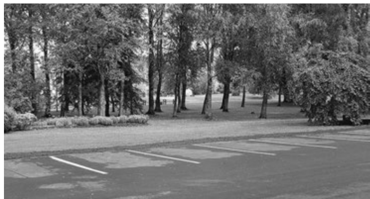
Piņķos izveidots autostāvlaukums un izbūvēts ceļš pie daudzdzīvokļu mājas Rīgas ielā 15.