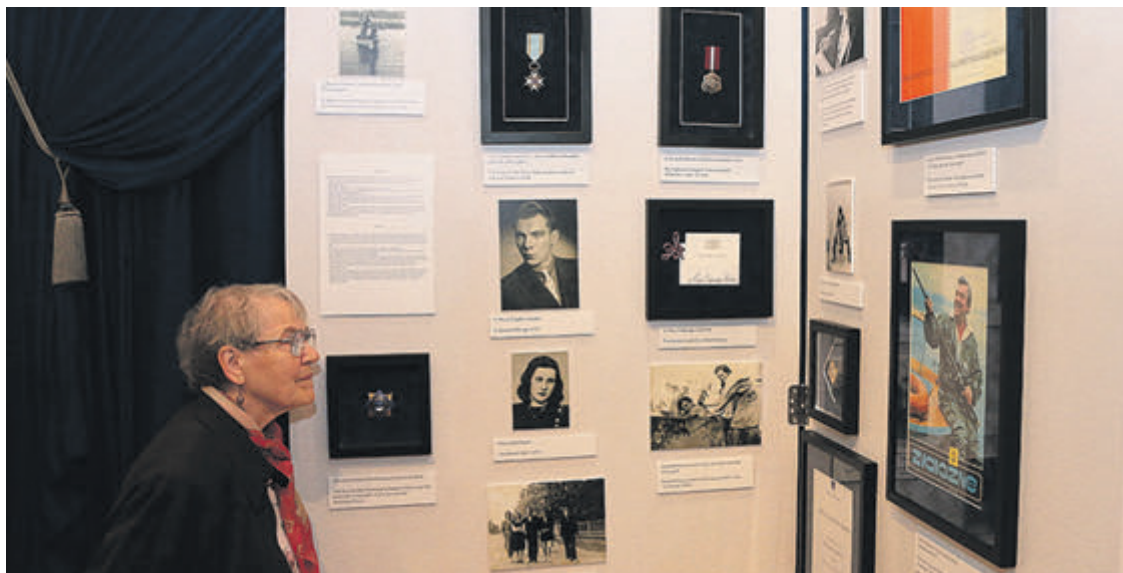
Izstāžu zāles atklāšana.

2017. gada 2. septembrī Babītes novada pašvaldības Kultūrizglītības centra filiālē Salas pagastā „Vietvalži” (Spunčiemā) ar tematisku pasākumu „Salas pagasts. Eduards Pāvuls. Savējais” tika atklāta izstāžu zāle – Eduardam Pāvulam veltīta memoriālā izstāde un ekspozīcija par Salas pagasta vēsturi.