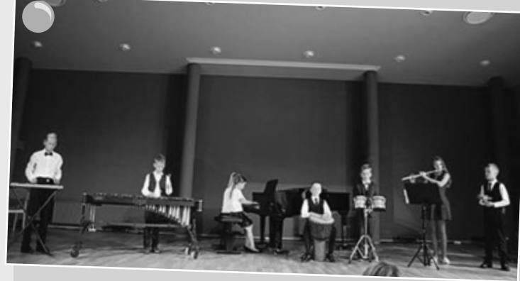
1. septembra koncerts Babītes mūzikas skolā.

(no tiem 37 uzsāks mācības 1. klasē, 23 – sagatavošanas klasē)