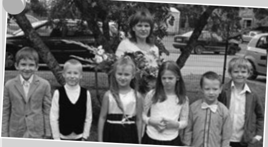
1. klases izglītojamie ar audzinātāju 1. septembrī Salas sākumskolā.

Šajā mācību gadā uzņemto bērnu skaits (pirmsskolas grupās): 8