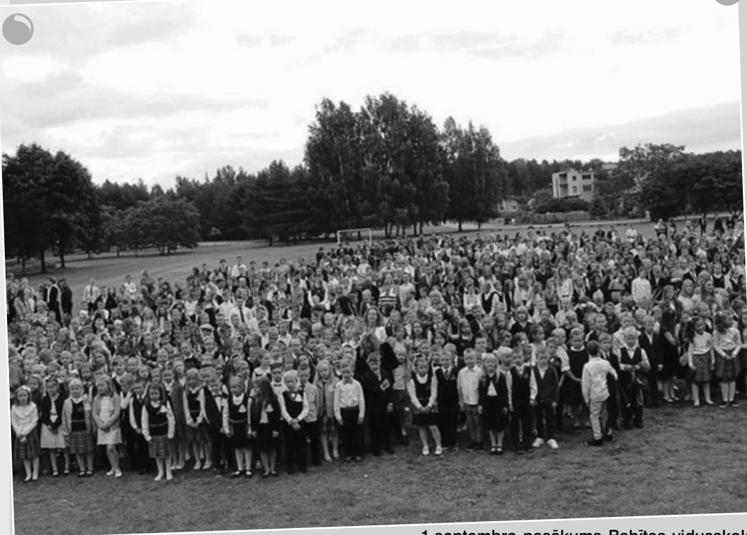
1. septembra pasākums Babītes vidusskolā.

Izglītojamo skaits: 933. 1. klase: 5; izglītojamo skaits: 120