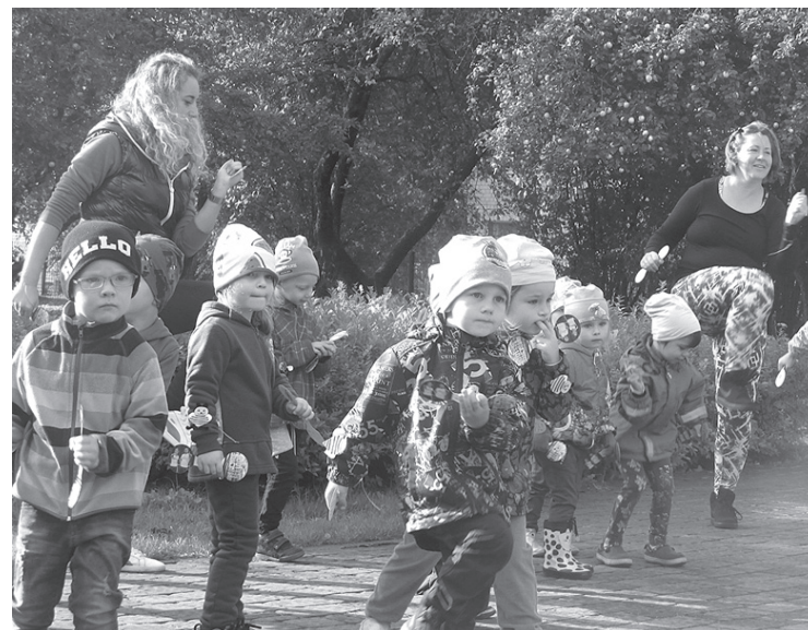
Babītes PII aktīvi aizvadīta Olimpiskā diena.

Tāpat kā citās Latvijas skolās, 22. septembrī arī Babītes pirmsskolas izglītības iestāde ar sportiskām aktivitātēm iesaistījās Olimpiskajā dienā, kuras sauklis bija „Vingro svaigā gaisā!”. Olimpiskās dienas kopīgā rīta vingrošana iedvesmoja un vienoja visus mazos un lielos sportistus.