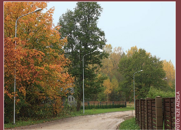
Vārpu ceļa posms Dzilnuciemā.