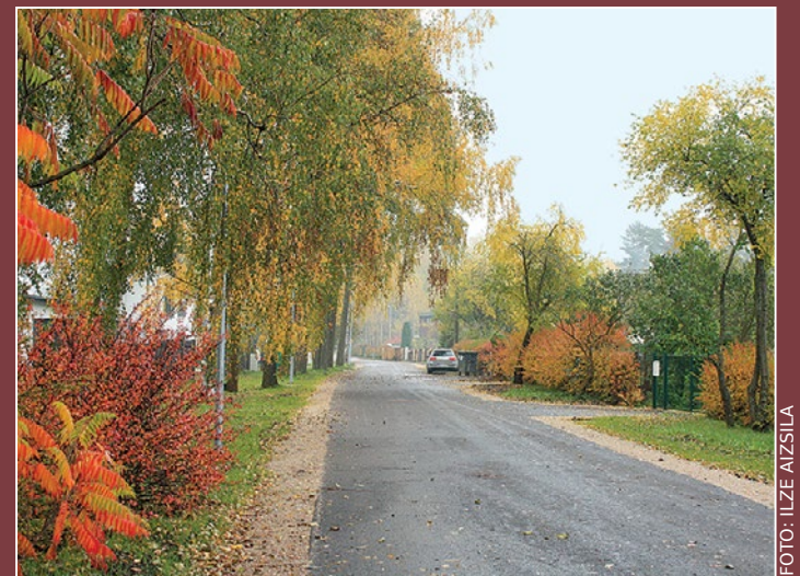
Meža ielas posms Babītē.