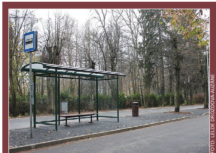
Bērzu iela Babītē.

Īstenotie projekti videoformātā aplūkojami pašvaldības interneta vietnē www.babite.lv .