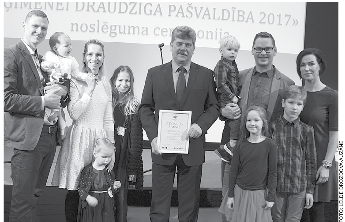
Noslēguma pasākumu kuplināja arī Babītes novada Liepu un Olekšu ģimenes.

14. decembrī Rīgas Motormuzejā notika Vides aizsardzības un reģionālās attīstības ministrijas rīkotā konkursa „Ģimenei draudzīga pašvaldība” apbalvošanas pasākums, kurā tika noskaidrotas ģimenei draudzīgākās pašvaldības Latvijā.