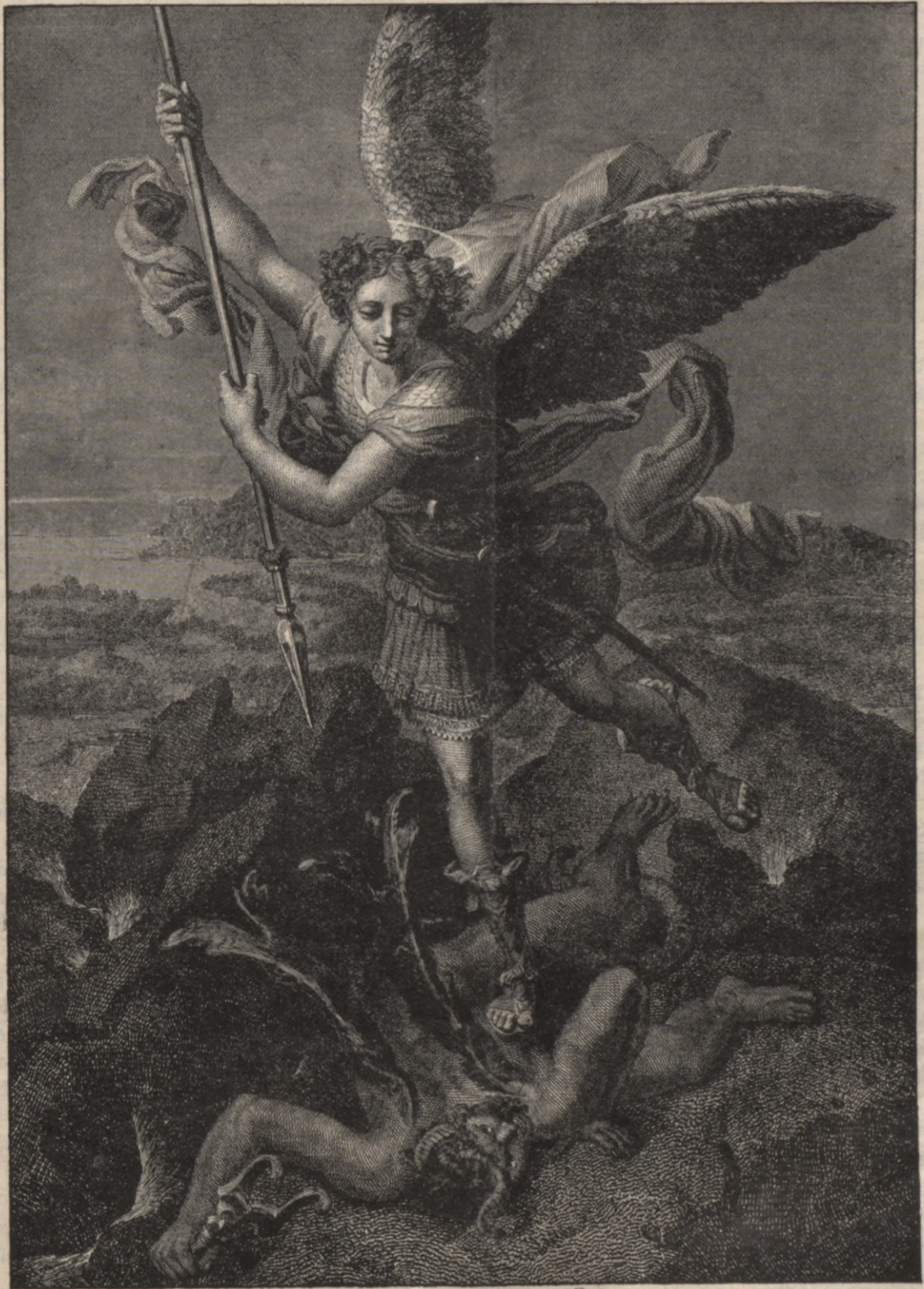
Саймас усвара — Рафаела.